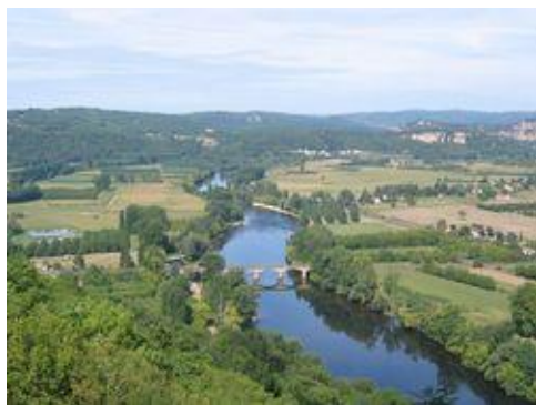
La Dordogne vue de Domme

Pour ceux que la distance rebute ou qui manquent de temps, nous proposons quatre options courtes qui permettent de ramener la distance totale jusqu'à 450 km environ sans toutefois dénaturer la randonnée.