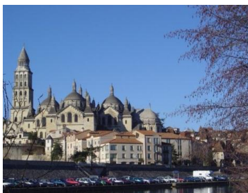
Périgueux – Cathédrale St Front